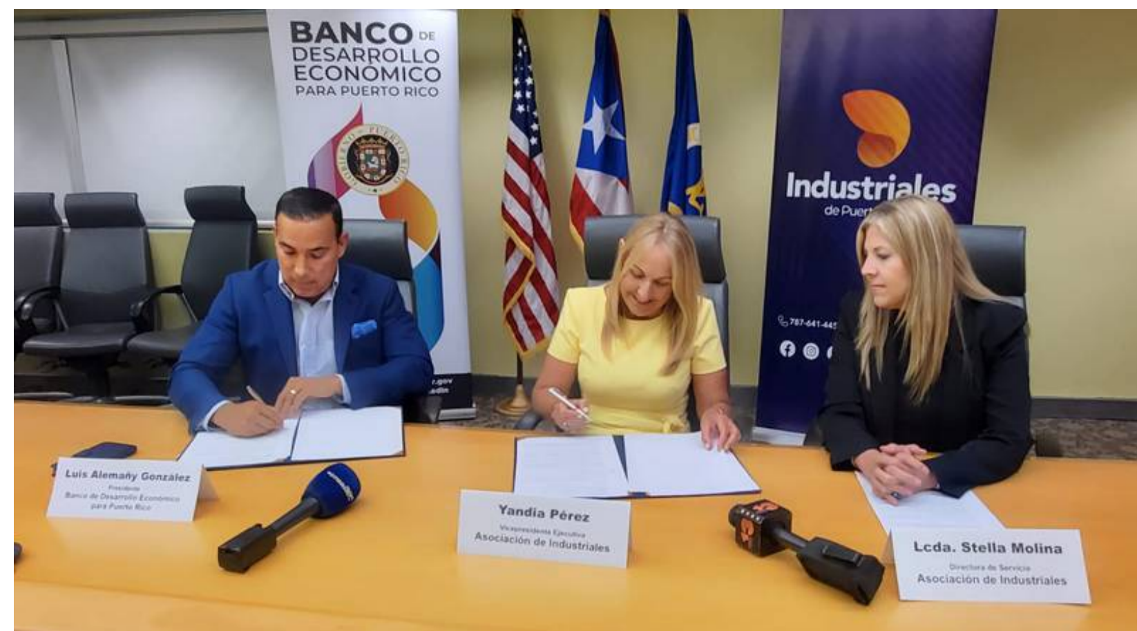
Banco de Desarrollo Económico

Se trata de la Alianza para el Desarrollo Económico de la Industria y el Comercio Puertorriqueño