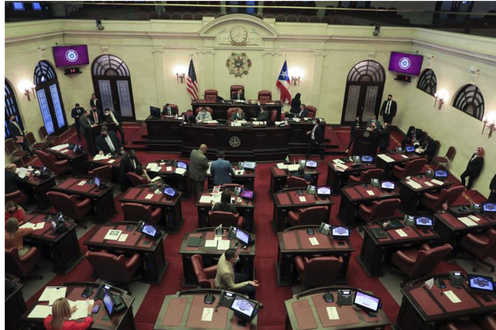
Foto de archivo del hemicycle del Senado.

Tras días de controversias, negociaciones y búsqueda de soluciones, el Senado y la Cámara de Representantes aprobaron hoy, miércoles, casi al filo de la medianoche, el informe de conferencia del proyecto de la Cámara 1367 que modifica el impuesto a las foráneas.